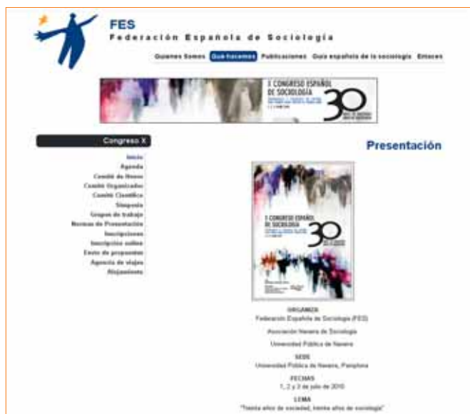
Portada de la página web del X Congreso Español de Sociología

Más info: http://www.fes-web.org/que-hacemos/congresos/X/