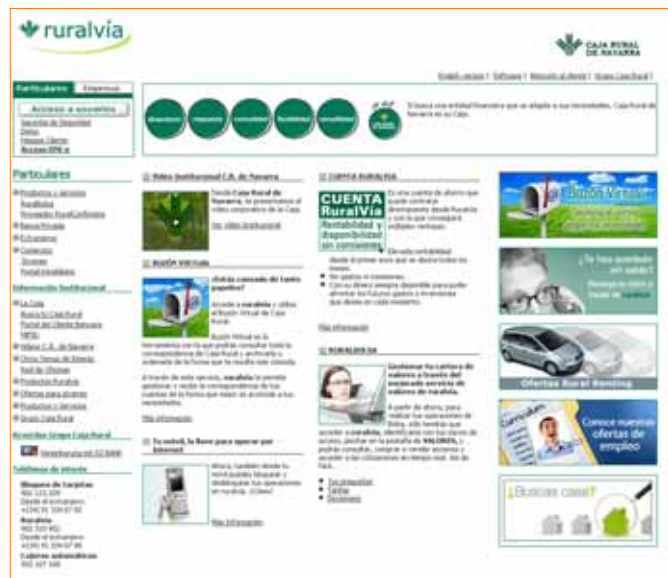
Página web de Caja Rural de Navarra

investigación o más la gestión. De esta forma, ya desde la carrera pueden ir orientando tanto sus estudios como sus aficiones paralelas (lecturas, cursos, cursillos, etc). En definitiva, si a un estudiante le gusta, por ejemplo, el tema de los recursos humanos, desde mitad de carrera ya puede ir orientando sus pasos hacia ese mundo, tanto en la Universidad como en su dedicación privada y particular.