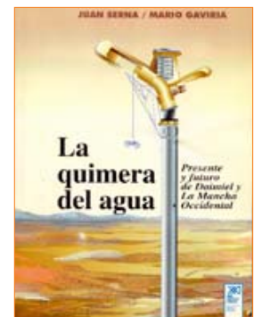
La quimera del agua