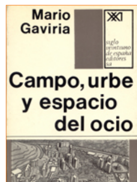
Campo, urbe y espacio del ocio