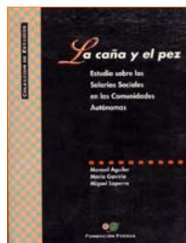
La caña y el pez