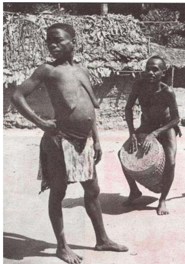
Los pigmeos, pese a sus inhumanas condiciones de vida, pese a su servidumbre, son sencillos y alegres, amantes de la danza y las fiestas.